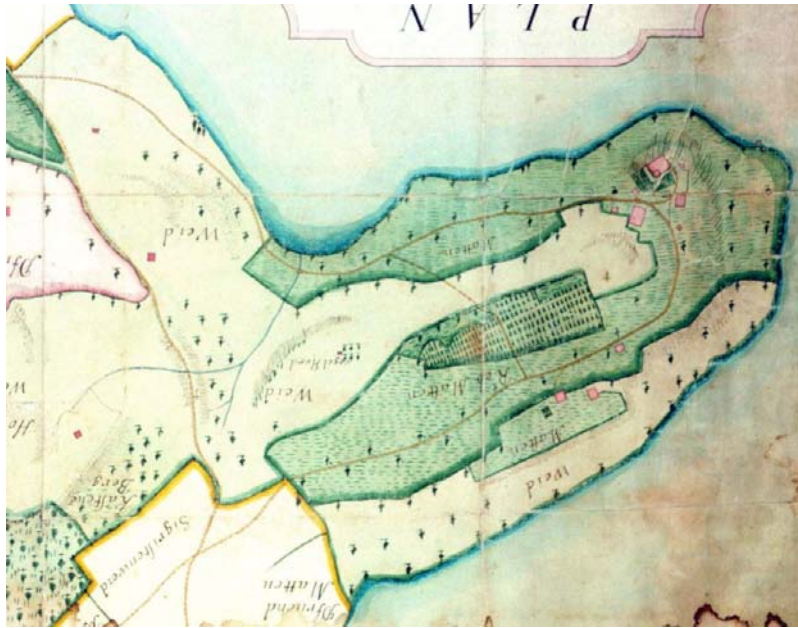
Kolorierter Plan von Jos Hess Fecit, 1779