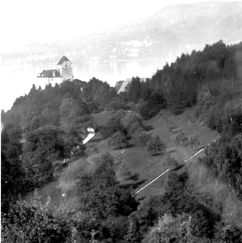
Fotografie undatiert (Kant. Denkmalpflege Zug)