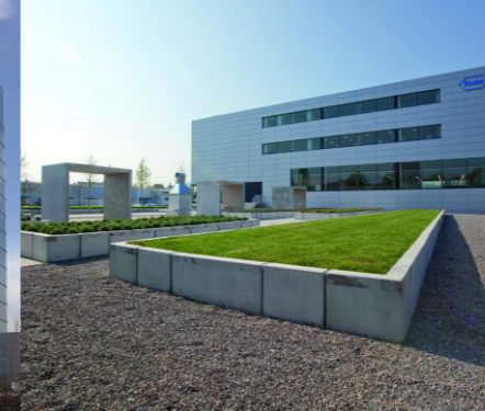
Burgdorf, Roche Diabetes Care