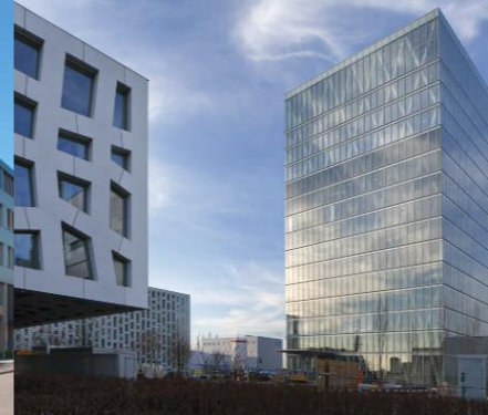
Rotkreuz, Hauptsitz Professional Diagnostics