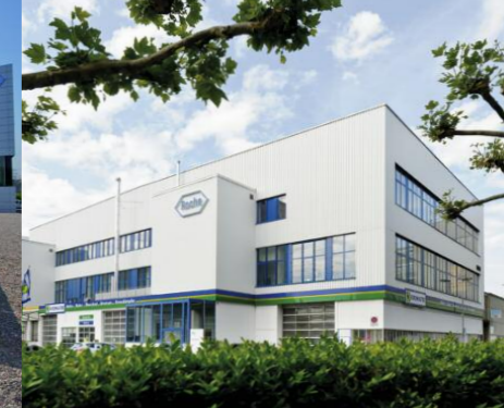
Schlieren, Roche Glycart