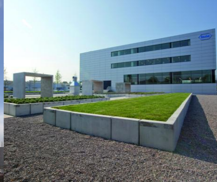
Burgdorf, Roche Diabetes Care