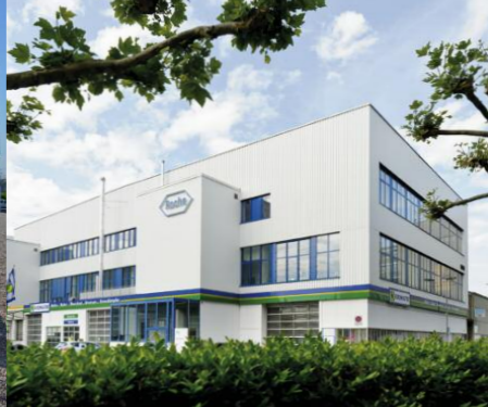
Schlieren, Roche Glycart