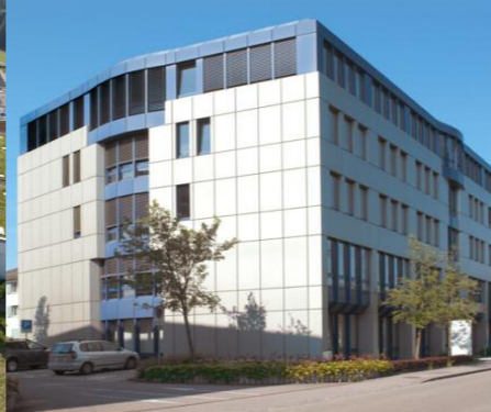
Roche Pharma Suisse, société d'exploitation