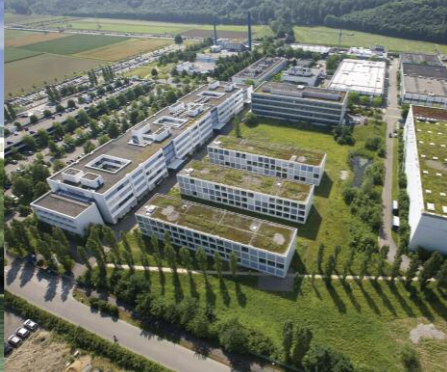
Kaiseraugst, casa madre