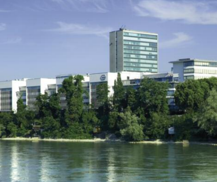
Basilea, casa madre