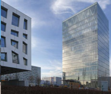
Rotkreuz, Professional Diagnostics, casa madre